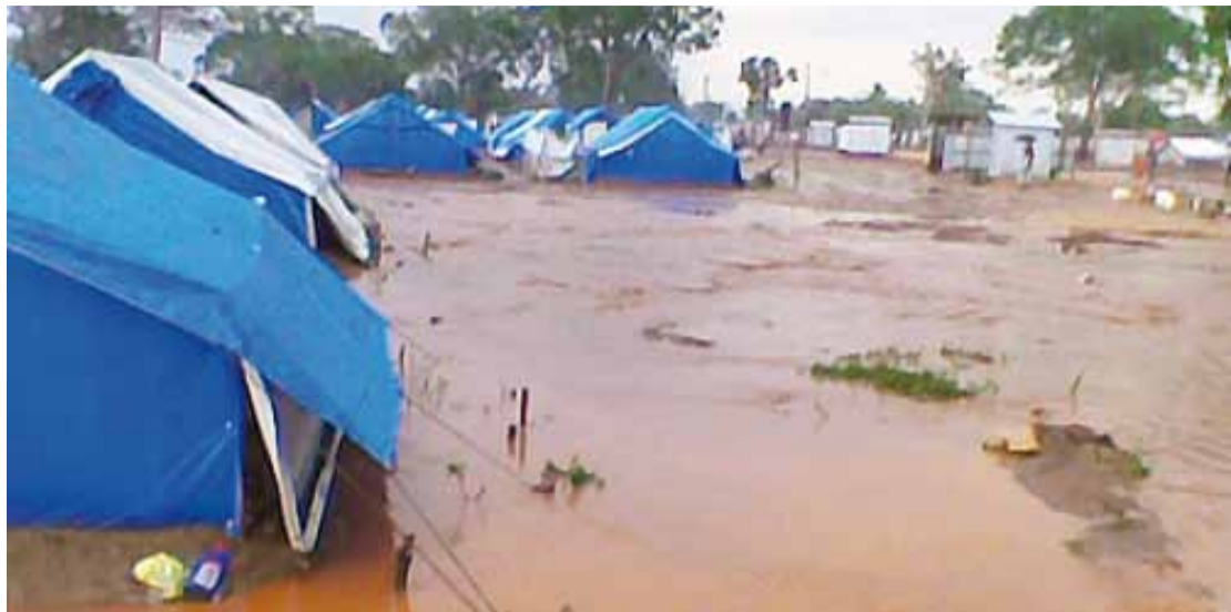
Fra en av leirene på Sri Lanka.

HRW har snakka med internerne. Ei kvinne med en ett år gammel sønn fortalte: «I løpet av sekunder strømmen vannet inn i teltene våre. Etter et par minutter var alt oversvømt. Vi mista alle tingene våre. Vi hadde ikke noe sted å lage mat. Vi kunne ikke få hjelp fra