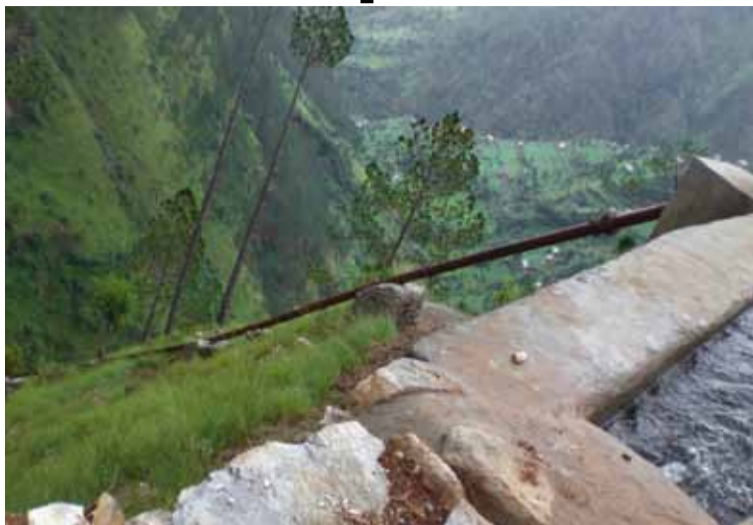
Kraftverk i Nepal.

Maoistregjeringa ble i vår pressa ut av regjeringskontorene gjennom et samarbeid mellom Arbeiderpartiets søsterparti Kongresspartiet og SVs søsterparti CPN(uml), med god hjelp fra India og USA.