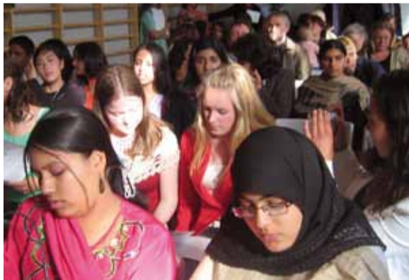
Avslutning på Hersleb skole.

Når ca. 40 prosent av elevene er såkalt minoritetsspråklige og boligmarkedet gjør at fattig og rik fordeler seg på øst og vest i byen, blir ikke elevgrunlaget jevnt fordelt. De fattige, ofte mørkere i huden, sokner til østkantskoler; mens