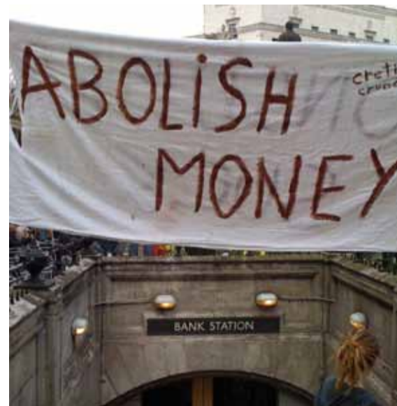
«Avskaff pengene.» Fra en demonstrasjon ved G20-møtet i London i april i år.

• Kjente økonomer i Europa venter at den europeiske arbeidsløsheten skal stige til 11,5 prosent i 2011, og